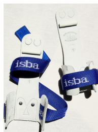
Dames brugongelijk ISBA

Maat: 00 tot 14 cm Maat: 0 14 tot 15 cm Maat: 1 15 tot 16 cm Maat: 2 16 tot 18 cm Maat: 3 + 18 cm