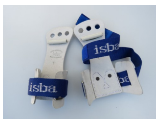
Heren rekleertjes ISBA

Maat: 0 tot 15 cm Maat: 1 15 tot 16 cm Maat: 2 16 tot 18 cm Maat: 3 18 tot 20,5 cm Maat: 4 + 20,5 cm