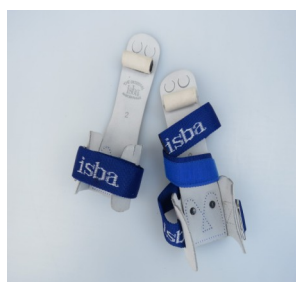
Ringleertjes heren ISBA

Maat: 0 tot 15 cm Maat: 1 15 tot 16 cm Maat: 2 16 tot 18 cm Maat: 3 18 tot 20.5 cm Maat: 4 + 20.5 cm